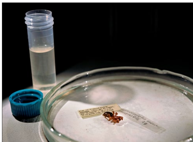
Slika 3: Primer inventarne enote iz zbirke pajkov z originalno etiketo, ki vsebuje osnovne podatke o vzorcu.

Po prevzemu v muzej je bila zbirka obravnavana kot muzejsko gradivo, pri katerem osnovno organizacijsko raven predstavlja inventarna enota. Ta predstavlja fizično zbirno enoto, ki vključuje enega ali več primerkov, zbranih na isti lokaliteti in ob istem času, ter omogoča sledljivost posameznih najdb (slika 3). Vsaki enoti pripadajo podatki o taksonomski določitvi, datumu vzorčenja, lokaliteti, številu primerkov ter podatki o zbiralcu in določevalcu. Gradivo iz različnih virov je bilo združeno v enotno podatkovno zbirko.