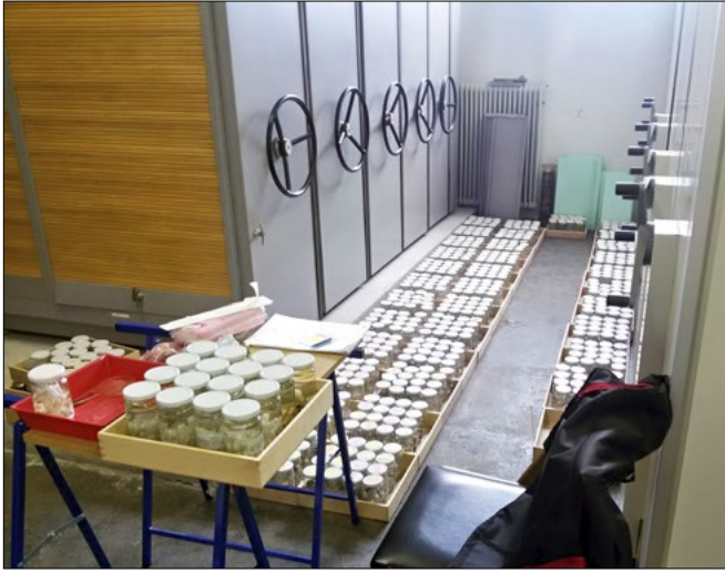
Slika 5: Po inventarizaciji je bilo gradivo sistematično razporejeno in pripravljeno za končno shranjevanje v depoju.

Figure 5: After inventorying, the material was systematically arranged and prepared for final storage in the collection repository.