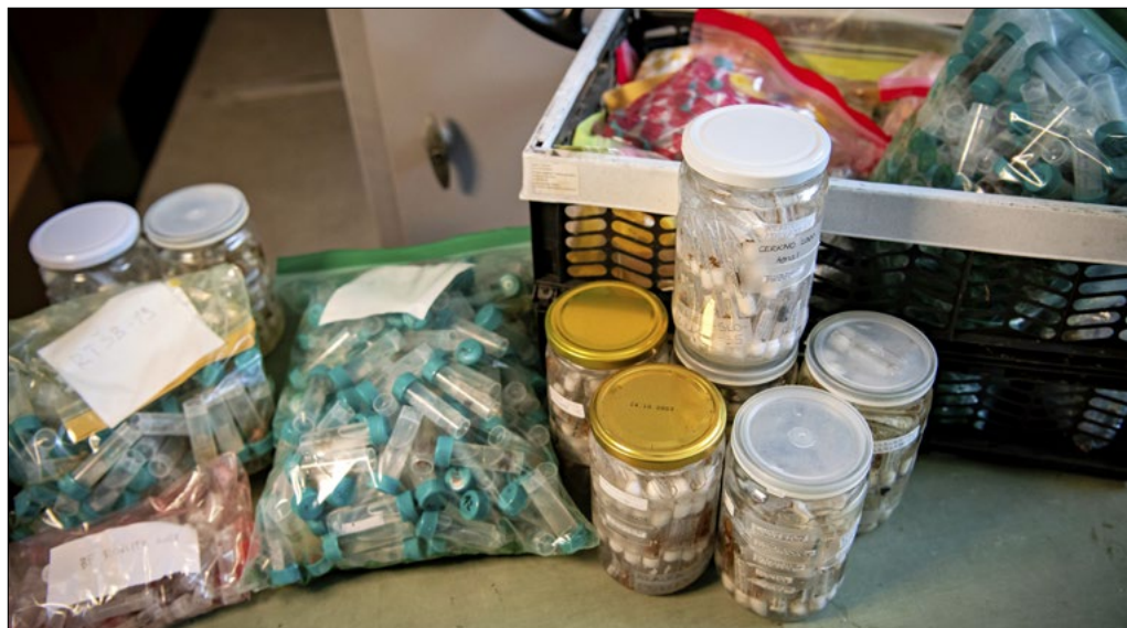
Slika 1: Del donirane zbirke pajkov ob prevzemu v Prirodoslovni muzej Slovenije. Gradivo je bilo shranjeno v epruvetah in kozarcih različnih formatov ter razporejeno v skupnih posodah z etanolom.

Figure 1: A portion of the donated spider collection at the time of accession to the Slovenian Museum of Natural History. The specimens are preserved in vials with labels of various formats and arranged in shared containers filled with ethanol.