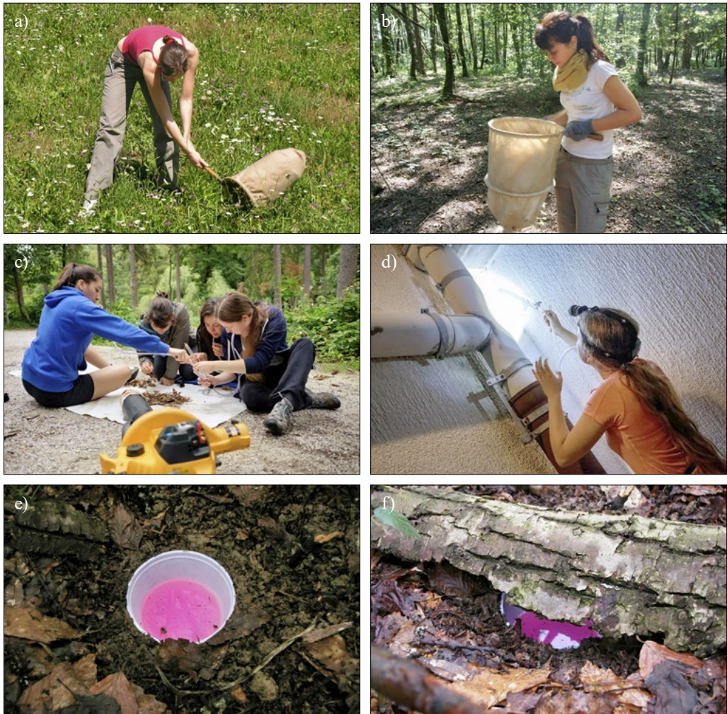
Slika 2: Različne metode vzorčenja pajkov: a) vzorčenje z lovilno vrečo, b) sejanje listne stelje, c) pregledovanje presejane stelje, d) ročno zbiranje z aspiratorjem in pregledovanje mikrohabitata, e, f) talne pasti.

Vzorčenje pajkov je bilo opravljeno z različnimi metodami, prilagojenimi terenu, namenu raziskave ali posameznemu projektu. Uporabljene so bile selektivne in neselektivne metode, vključno z ročnim lovom z uporabo aspiratorja ali pincete, stresanjem vegetacije (ang. “beating”), uporabo lovilne vreče (ang. “sweep netting”) in sejanjem listne stelje (ang. “sifting”). V posameznih primerih so bile uporabljene tudi talne pasti s sredstvom za konzerviranje za daljše obdobje vzorčenja (slika 2).