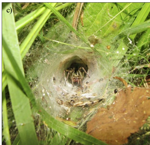
Slika 7: Predstavniki treh najštevilčnejših družin v zbirki: (a) baldahinarji (Linyphiidae), (b) skakači (Salticidae) in (c) lijakarji (Agelenidae).