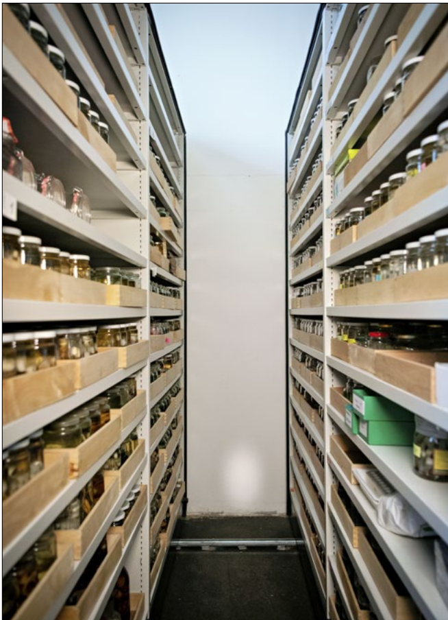
Slika 6: Del donirane zbirke pajkov po prenosu, urejanju in vključitvi v Študijsko zbirko pajkov Prirodoslovnega muzeja Slovenije.

Figure 5: After inventorying, the material was systematically arranged and prepared for final storage in the collection repository.