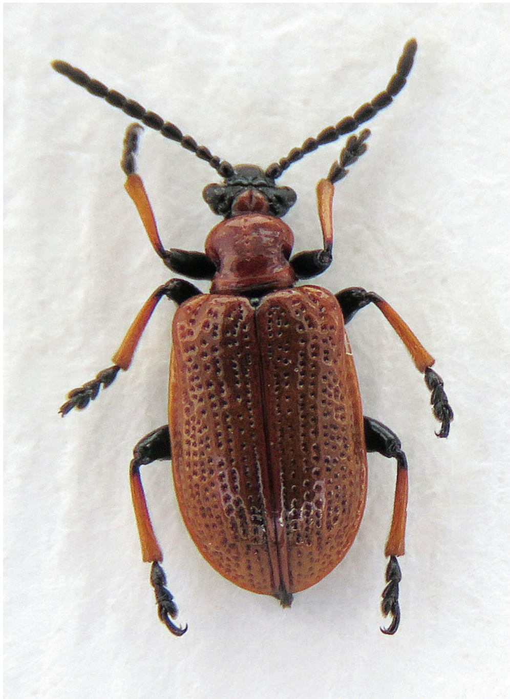
Sl. 2: Lilioceris tibialis , naravna velikost: 7,7 mm