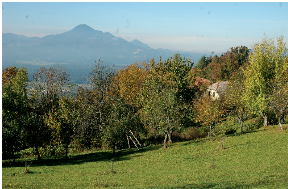
Sl. 2: Lokacija najdbe Spoladea recurvalis na Brdah na Pohorju, kjer je vrsta zabeležena 16. 11. 2014. V ospredju travnik in sadovnjak.

Odrasli osebki imajo premer sprednjih kril od 22 do 24 mm. So čokoladno rjave barve in imajo na sprednjih krilih po dve, na zadnjih pa po eno belo prečno liso (Slika 1). Letajo od maja do septembra, odvisno od lokacije. Gosenice so polifage in se hranijo z različnimi kulturnimi rastlinami, kot so špinača ( Spinacia ), pesa ( Beta ), bombaž ( Gossypium ), koruza ( Zea ), soja ( Glycina ), ščir ( Amaranthus ) in tolščak ( Portulaca ). V naravi se hranijo z različnimi divjimi rastlinami. Gosenice so zelenkaste barve in odrasle merijo okrog 19 mm. Zabubijo se v rahlem zapredku v zapognjenem delu lista. Bube so svetlo rjave barve. Metulji se v tropskem podnebjju izležejo v 10 do 12 dneh (Wikipedia 2015).