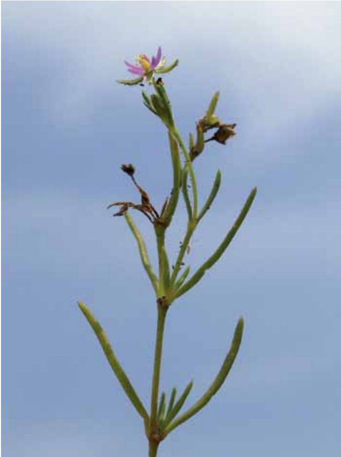
Slika 22. Spargularia marina (L.) Besser