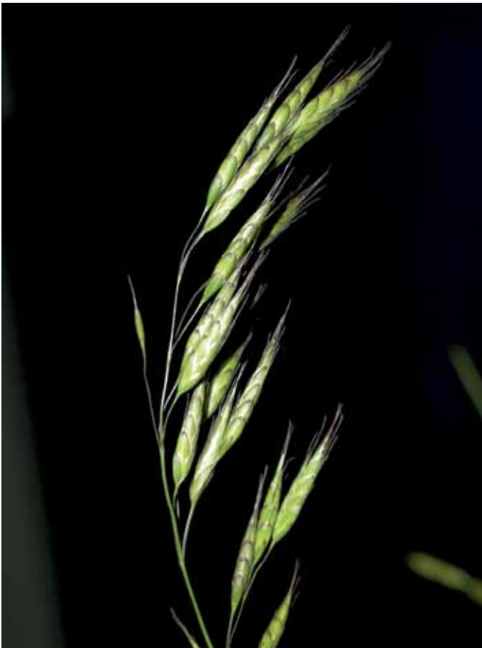
Slika 4. Bromus squarrosus L.

O tej vrsti znanih podatkov za SV Slovenijo zaenkrat ni, drugod po Sloveniji pa je razširjena le na Primorskem (JOGAN et al., 2001). Vezana je na suha ruderalna mesta (JOGAN v MARTINČIČ et al., 2007), zato bi jo lahko na prehodnih rastiščih pričakovali tudi drugod po državi. Vrsto smo našli na peščenem rastišču blizu krožišča pri AC blizu vasi Hraščice, kjer je skoraj prevladovala med