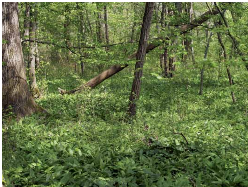
Slika 27. Spomladanska vegetacija v gozdu ob Muri.

Mrtvice in mrtve rokave v zahodnem delu Dolinskega ogrožajo predvsem trenutni posegi v prostor, kot je sečnja dreves v zimskem času, zasipanje s smetmi (še posebej z gradbenim materialom, azbestnimi ploščami ter raznimi aparaturnami), ali pa dolgosežni, kot so npr. neustrezne mediacije. V zadnjem času se ponovno odpira vprašanje energijskega izkoristka pretoka reke Mure in načrtovano izgradnjo pretočnih HE. Mokrišča ob reki Muri bi to gotovo močno ogrozilo, če ne popolnoma uničilo, saj še vedni ni pravih analiz o tem, kako bi dvig/padec vode v rečni strugi vplival na obrežno vegetacijo in na vegetacijo v zaledju obstoječih nasipov.