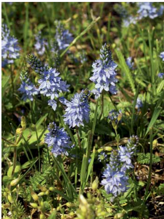
Slika 23. Veronica prostrata L.

Navedb o poleglem jetičniku za Slovenijo je zelo malo (JOGAN et al., 2001), v Prekmurju pa še ni bil opažen (BAKAN, 2006). Uspeval naj bi na suhih traviščih kolinskega pasu (ADLER et al., 1994) in na pašnikih (Fischer v Martinčič et al., 2007). Nekaj bogato cvetočih primerkov smo našli na manjši zelenici ob bencinski črpalki na začetku Črenšovcev. Glede na bližino ceste in antropogeno rastišče (košena trata) lahko sklepamo, da je zanešena s transportnim prometom. Avstrijska flora (ADLER et al., 1994) jo obravnava kot zmerno pogosto v panonskem delu države, sicer pa velja za zelo redko.