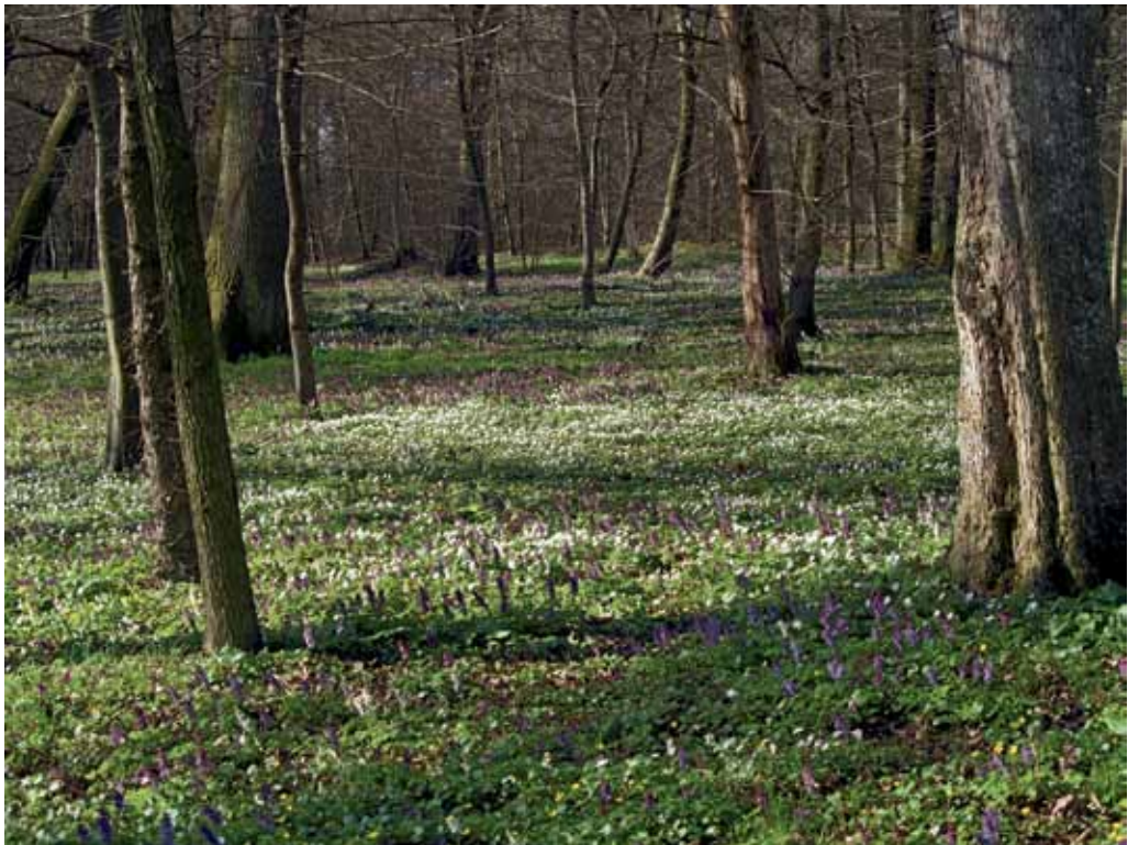
Slika 28. Hraščički log.

Z vidika ohranjanja in varovanja pa so pomembni tudi poplavni gozdovi ob Muri. Ti so se ohranili zgolj v ozkem, dober kilometer širokem pasu, v glavnem pa gre za fragmente nekadanjih obsežnih dobovo-gabrovih gozdov ( Querceto robori-Carpinetum ) z bogato in pestro zeliščno floro. Poleg doba in gabra je pomembna lesna vrsta teh gozdov dolgocepljati brest ( Ulmus laevis ), ki pa ga včasih nadomestijo s topoli in jesenom. Značilna in zelo pogosta vrsta teh gozdov, ki je drugod po Sloveniji redka, je spomladanska torilnica ( Omphalodes scorpioides ) ob kateri uspevajo tudi druge, manj ali bolj pogoste vrste, npr. Scilla bifolia , Helleborus dumetorum , Allium