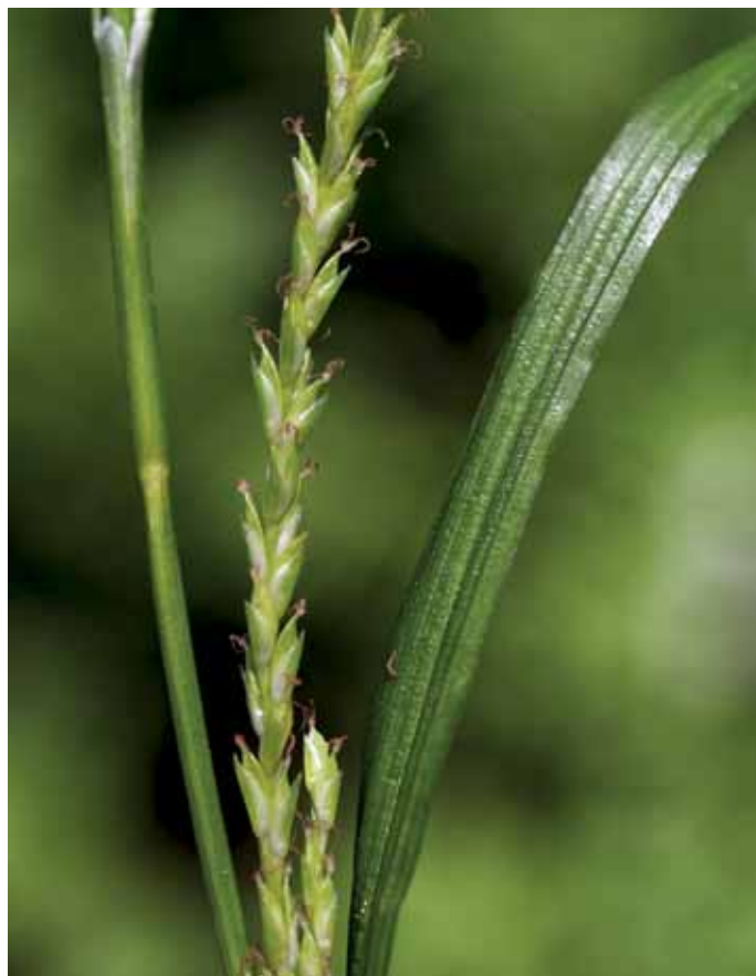
Slika 7. Carex strigosa Huds.

Ozoklasi šaš je eden redkih atlantsko-submediteranskih elementov (HORVÁTH et al., 1995), ki se pojavlja v tem delu Slovenije. Da gre za v slovenskem merilu redko vrsto, ki je opredeljena kot prizadeta (E) (ANON., 2002), kažejo izjemno redke najdbe (JOGAN et al., 1999; 2001), ki v veliki meri izhajajo iz 19. stoletja (JOGAN et al., 1999). Razlog temu je morda tudi zamenjava z zelo pogosto vrsto C. sylvatica , s katero si ne deli le podoben habitus, ampak tudi podobna rastišča. Ozoklasi šaš smo popisali v poplavnem logu ob Muri med Ižakovci – brodom in farmo Nemščak, našli pa smo ga tudi v manjšem hrastovem sestoju blizu Dolnje Bistrice (Orlovšček). Uspeva na senčnih, nekoliko vlažnejših tleh v gozdovih ali ob potokih (TRČAK v MARTINČIČ et al., 2007), pogosto je več šopov na posamezni lokaciji. Po pravilniku (ANON., 2002) je vrsta opredeljena kot prizadeta (E), na Madžarskem pa je tudi zavarovana (KIRÁLY, 2007).