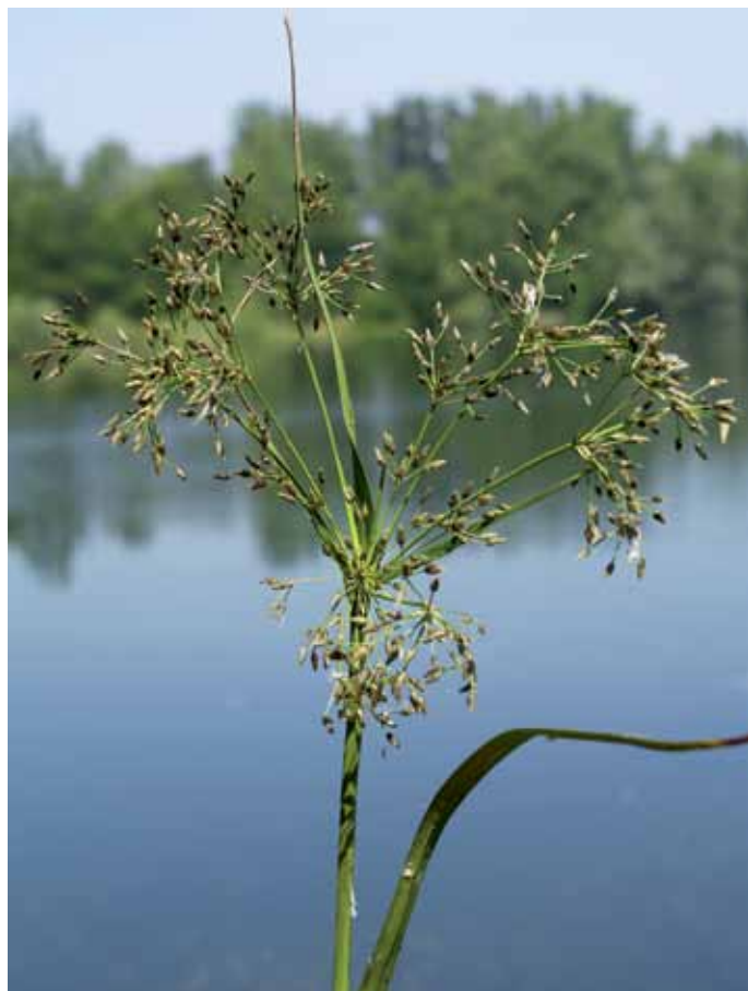
Slika 21. Scirpus radicans Schkuhr