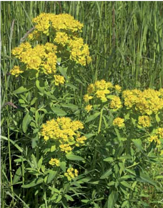
Slika 10. Euphorbia palustris L.

Nahajališča močvirske logarice v Prekmurju so dobro znana (GODICL, 1992; ACCETTO, 1990; idr.). Zanimivo je njeno pojavljanje na dveh, popolnoma različnih habitatih: v svetlih, delno zamočvirjenih gozdovih in na srednje do slabo dognojevanih vlažnih travnikih. Primarna rastišča tega evropskega elementa (HORVÁTH et al., 1995) so bili poplavni gozdovi in ACCETTO (1990) jo je celo opredelil kot značilnico oz. razlikovalnico (1985) v združbi Ulmo-Quercetum , redkeje pa naj bi se pojavljala tudi v združbi Quercus roboris- Carpinetum (kot je npr. Hraščički gozd), lahko pa tudi v asociaciji Carici elongatae-Alnetum glutinosae , kot je npr. Črni log pri Veliki