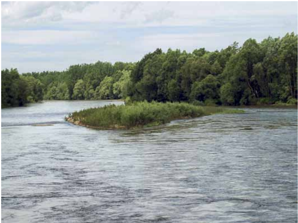
Slika 26. Eno od prodišč na reki Muri.

Z vidika ohranjanja floristične pestrosti se nam zdi pomembna tudi gramoznica pri Melincih, ki jo lastnik stalno preureja in izkorišča. Tu smo našli nekatere redke vrste kot so Rumex palustris , Veronica catenata , Myriophyllum verticillatum , Cyperus glomeratus , Myosotis cespitosa , Crepis setosa , Rorippa amphibia , Potentilla supina , Eleocharis acicularis , idr., v neposredni bližini gramoznice pa se nahaja peščena stena z gnezdišči breguljk ( Riparia riparia ), ki je kvalifikacijska