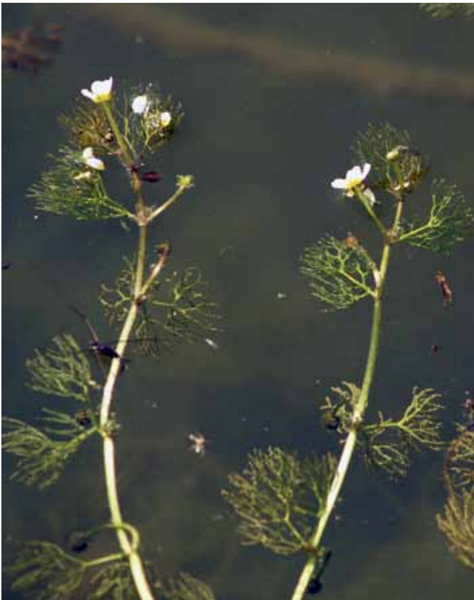
Slika 18. Ranunculus trichophyllus Chaix subsp. trichophyllus

O lasastolistni vodni zlatici za SV Slovenijo podatkov praktično ni (JOGAN et al., 2001), čeprav naj bi uspevala v stoječih in počasi tekočih vodah po vsej Sloveniji (PODOBNIK v MARTINČIČ et al.,