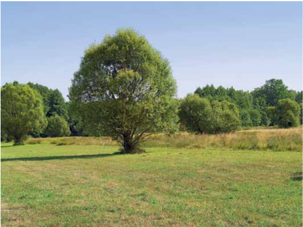
Slika 30. Mokrotni travniki med Črenšovci in Srednjo Bistrico.

Pri tem se nam zastavlja vprašanje na kakšen način bi bilo smotrno ohranjati motena rastišča, kot so obcestni jarki, zapuščena smetišča, opustele njive, nadomestni habitati, ki so vzpostavljeni ob avtocesti, zasipališča, ipd., kot mesta, kjer se prehodno pojavljajo tudi redke in ogrožene vrste. Posebej zanimivo rastišče za razne vrste predstavlja nadomestni habitat blizu avtoceste, na izvozu pri Lipovcih. V dobrih štirih letih so se tu razbohotile nekatere lesne vrste, npr. Salix eleagnos , S. purpurea in Populus alba , zelo pogosta vrsta pa je tudi Chamerion dodonaei . Med drugimi zanimivimi vrstami, ki smo jih popisali na tej lokaciji in ob železniški progi blizu silosev, ki je le kakih 50 m vstran, so Verbascum lychnitis , Centaurea macroptilon , C. rhenana , Spergularia