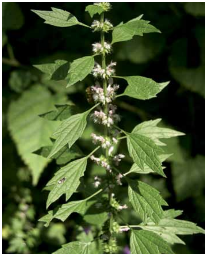
Slika 14. Leonurus cardiaca L.