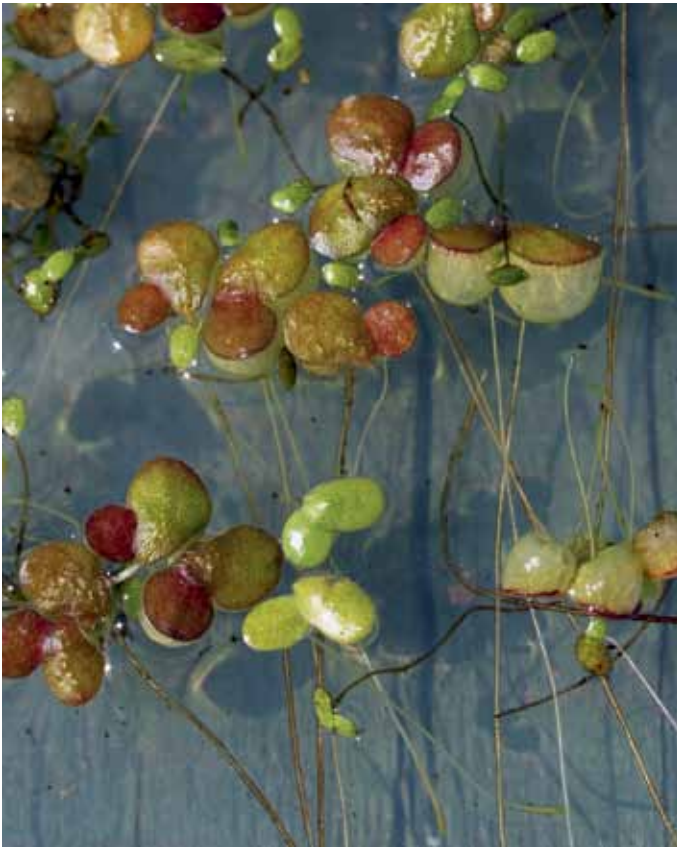
Slika 13. Lemna gibba L.