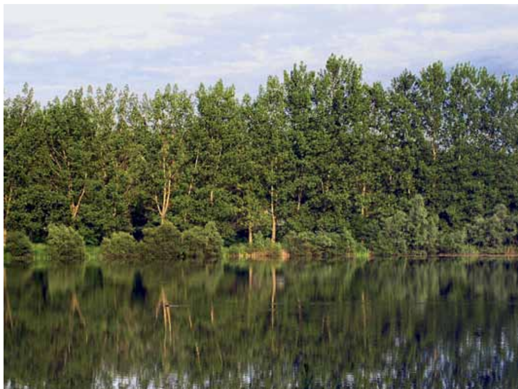
Slika 25. Pogled na južno gramoznico med Dokležovjem in Muro.

Blizu železniške proge, južno od vasi Dokležovje, se nahajata dve veliki gramozni jami, ki se občasno bolj ali manj še vedno izkoriščata za izkop gramoz. V obeh gramoznicah, predvsem pa v obrežnem pasu, vsako leto popišemo nove vrste, saj se sam habitat zaradi človekove dejavnosti nenehno spreminja. Med vodnimi vrstami se tu redno ali prehodno pojavljajo vrste kot so Najas marina , N. minor , Ranunculus circinatus , R. trichophyllus ssp. trichophyllus , Potamogeton nodosus , P. lucens , P. crispus , P. pectinatus , Myriophyllum verticillatum , M. spicatum ,