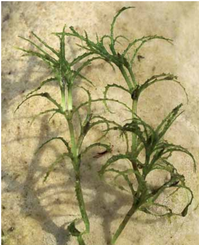
Slika 15. Najas minor All.

Poleg male podvodnice se v gramoznicah in mlakah vzdolž Mure raztreseno pojavlja tudi velika podvodnica ( N. marina L.) (BAKAN, 2006). Za širše območje Štajerske malo podvodnico