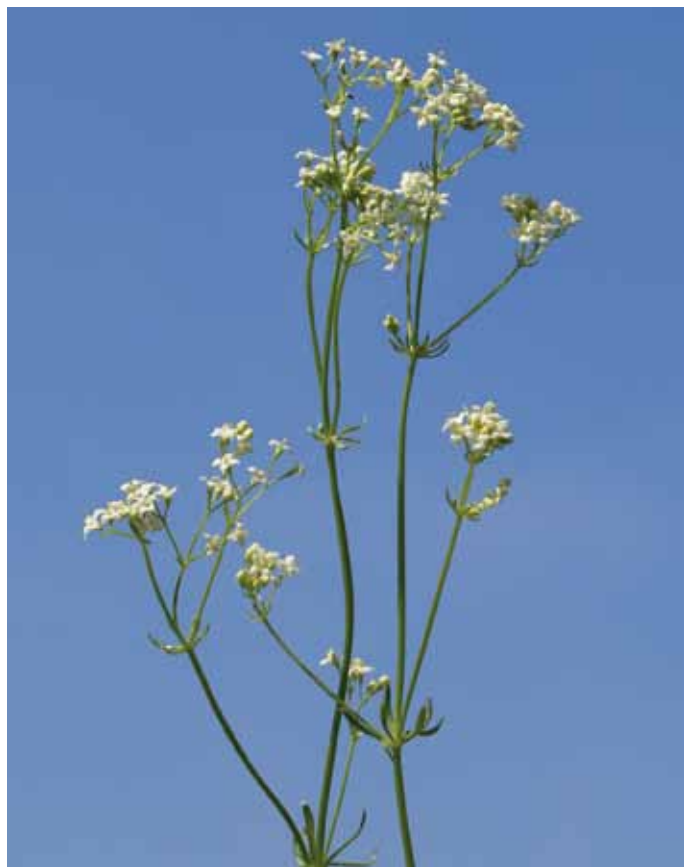
Slika 11. Galium pumilum Murray

Nizka lakota je ena tistih vrst, ki je glede na razširjenost v Sloveniji (JOGAN et al., 2001) in po ekoloških prilagoditvah sodeč (MARTINČIČ v MARTINČIČ et al., 2007), v nižinskem delu Prekmurja