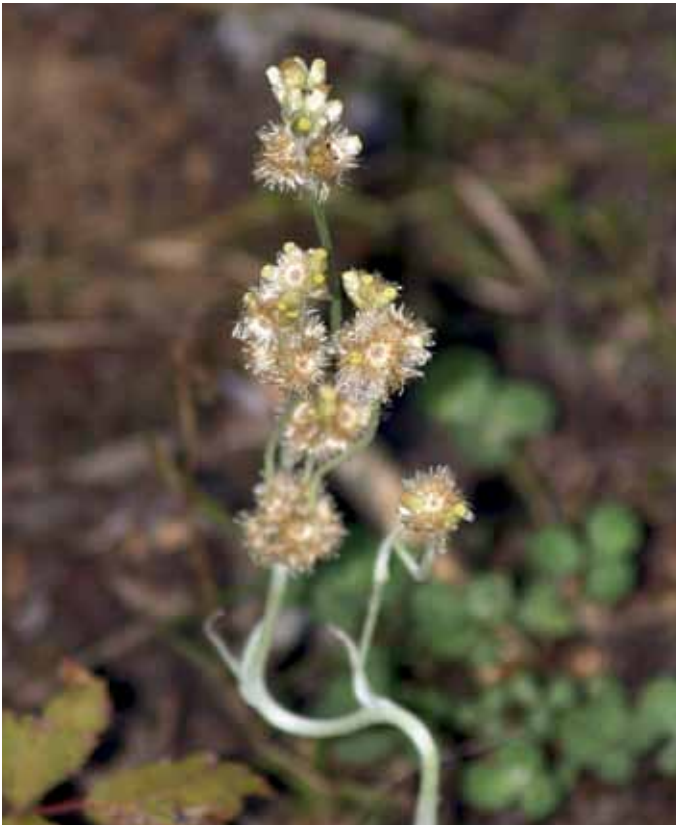
Slika 12. Gnaphalium luteoalbum L.

Novejših podatkov o pojavljanju te vrste v Sloveniji ni bilo kar nekaj časa (WRABER v MARTINČIČ et al., 2007), zato je naša navedba za gramoznico pri Gančanih ena prvih v zadnjih