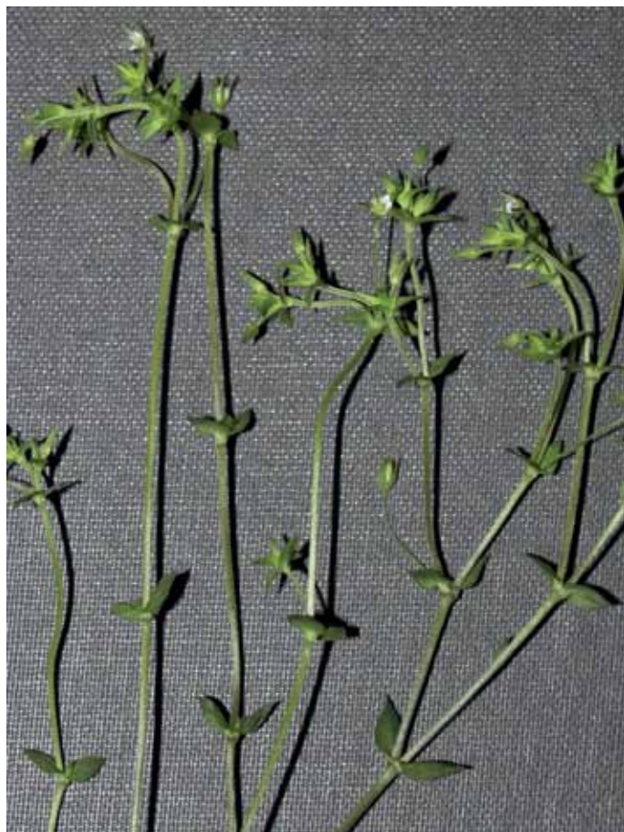
Slika 3. Arenaria leptoclados L.

Manj pogosto vrsto peščenke smo našli na strniščni njivi blizu Dokležovja nedaleč od železniškega mostu čez reko Muro. V avstrijski flori je navedena za panonsko območje (ADLER et al., 1994), zato smo jo pričakovali tudi v Prekmurju, čeprav je tipično submediteranska vrsta (HORVÁTH et al., 1995) in je tudi v Sloveniji razširjena v glavnem le na Primorskem (JOGAN et al., 2001). Glede na opis rastišč, kot so peščeni ali kamniti kraji, pa tudi suha travišča (VREŠ v MARTINČIČ et al., 2007), bi vrsto lahko pričakovali tudi na Goričkem. Za Slovenijo je opisana samo tipska podvrsta.