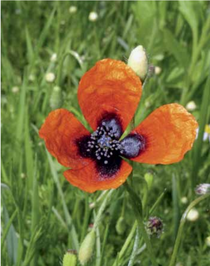
Slika 16. Papaver argemone L.