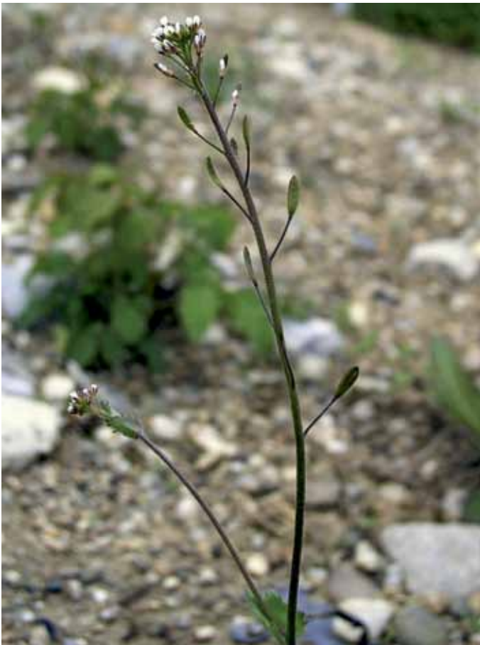
Slika 8. Draba muralis L.

HAYEK (1923) navaja za okolico Radgone pozidno g. ( Draba muralis L.), prav tako redko vrsto gladnice, katere uspevanje pa v tem delu Slovenije že dolgo ni bilo potrjeno.