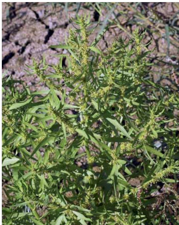
Slika 19. Rumex palustris L.

Močvirska kislica je skupaj z zlatorumeno k. ( R. maritimus L.) redkejša vrsta kislice, vezana v glavnem na peščena, prodnata, redkeje ilovnata tla obrežij ribnikov, rek ter mrtvic (VREŠ v MARTINČIČ et al., 2007). Našli smo jo v glavnem ob gramoznicah v Melincih, Dokležovju in Lipovcih, večje (prehodne) sestoje pa tvori na Ledavskem jezeru (BAKAN, 2006), kjer raste skupaj z zlatorumeno kislico (Kaligarič, nn; BAKAN, 2006). Ta evrazijska vrsta je v Sloveniji na pravilnik uvrščena kot ranljiva vrsta (V) (ANON., 2002).