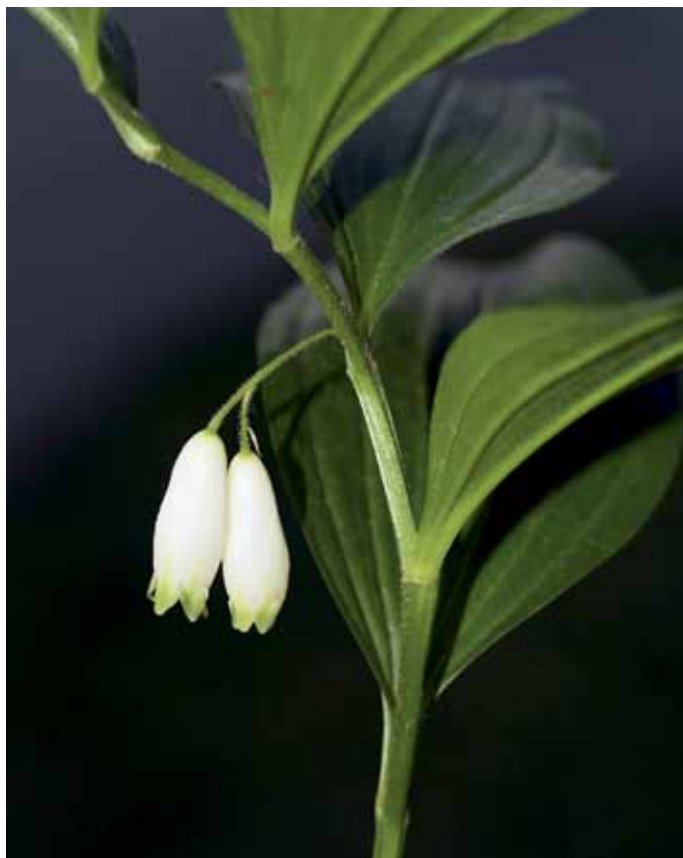
Slika 17. Polygonatum latifolium (Jacq.) Desf.