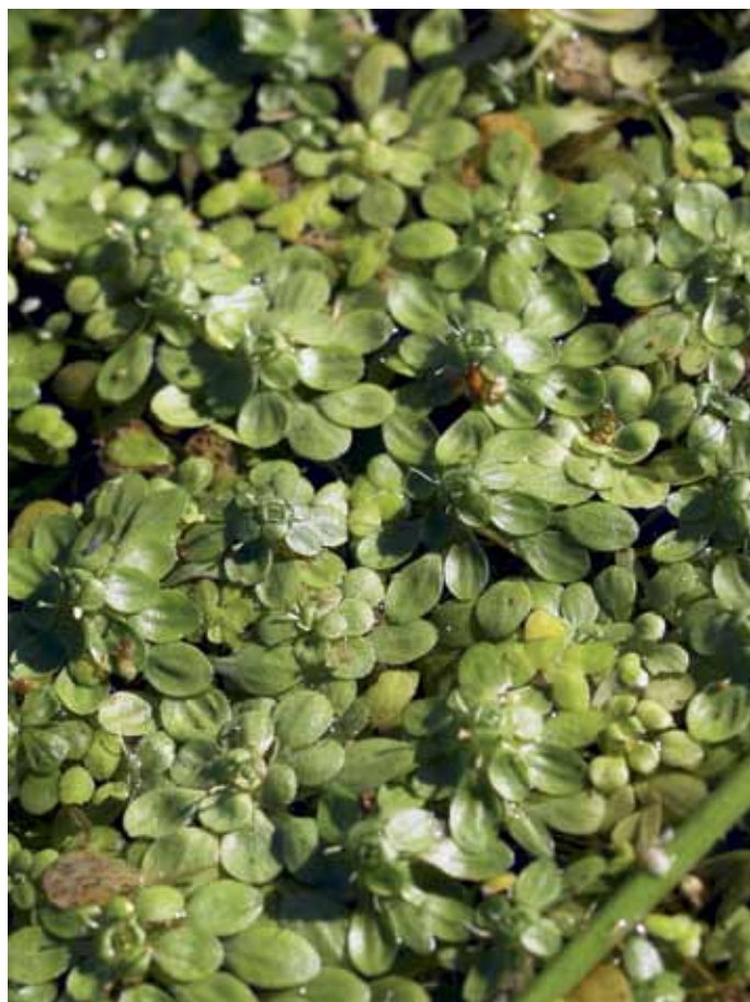
Slika 5. Callitriche cophocarpa Sendtn.

Mnogolistni žabji las pripada taksonomsko težavnemu rodu, v okviru katerega je najpogostejša C. palustris (JOGAN et al., 2001). V predzadnji izdaje MFS (MARTINČIČ et al., 1999) se omenjajo za SLO 3 vrste tega rodu, v najnovejši izdaji (MARTINČIČ et al., 2007) pa že 4, medtem ko jih avstrijska flora navaja kar 6 (ADLER et al., 1994). Mnogolični ž. l. poseljuje stoječe ali počasno tekoče, nekoliko bolj evtrofizirane vode (ADLER et al., 1994), ki so precej pogost habitat v SV Sloveniji.