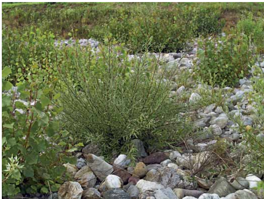
Slika 29. Nadomestni prodni habitat pri Lipovcih ob avtocesti.

Ob Ledavi, severno od vasi Gančani in blizu vasi Hraščice in Renkovci, se nahaja dobrih 360 ha velik Hraščički log. Tvori jo ga naravni hrastovo-gabrovi sestoji, vmes pa najdemo tudi zasaditvene odseke z gladkim borom ( Pinus strobus ), predvsem v vzhodnem delu pa je gosto zasajevan tudi rdeči bor ( Pinus sylvestris ). Flora Hraščičkovega loga je bogata in pestra, tipična za ta prostor, popisali pa smo več zanimivih in redkih vrst: Fritillaria meleagris , Gagea spathacea , Dryopteris dilatata , Pulmonaria mollis , Scilla bifolia , Epipactis helleborine , idr. Pred dobrima