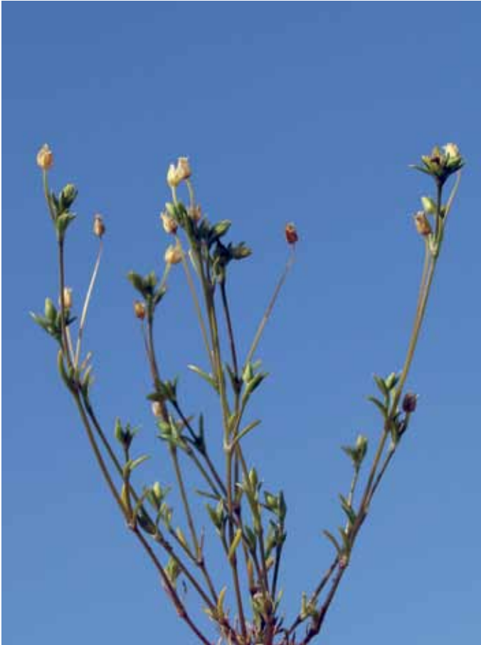
Slika 20. Sagina apetala Ard. subsp. apetala