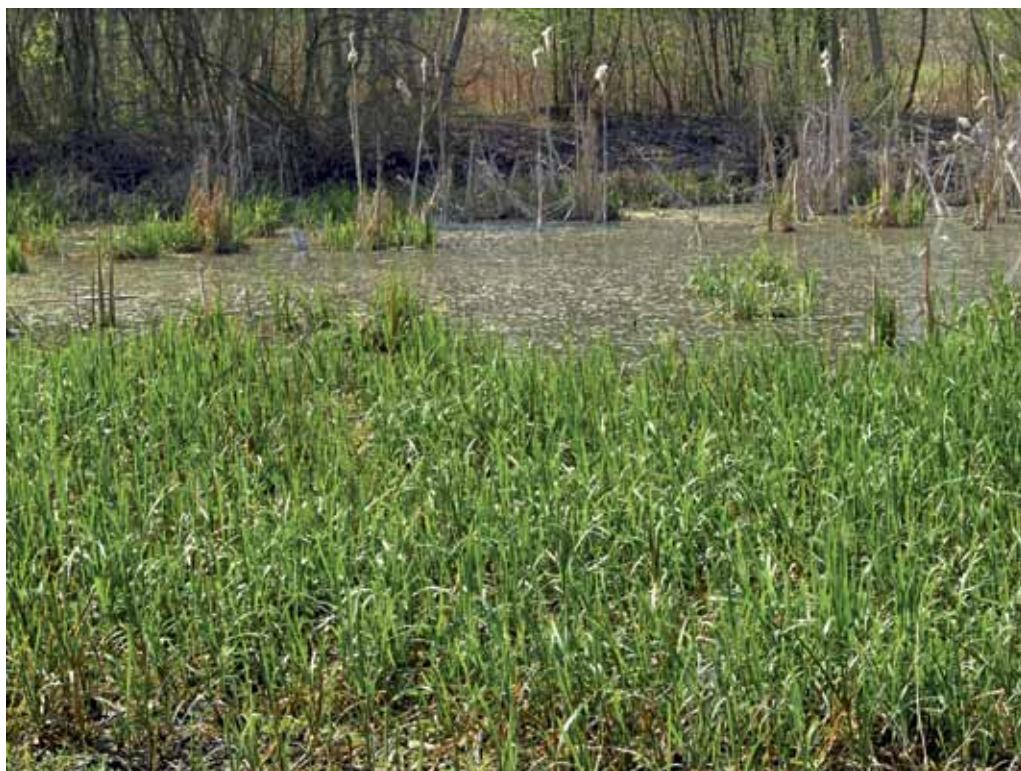
Slika 24. Mrtvi rokav blizu Dokležovja.

Manj znana mrtvica se nahaja tik ob farmi Nemščak, ki se v južnem delu zarašča z veliko sladiko ( Glyceria maxima ), ob zahodnem robu pa s trstičevjem ( Phragmites australis ). Predvsem