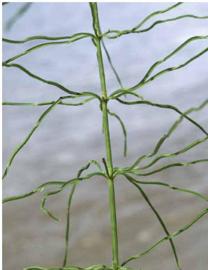
Slika 9. Equisetum pratense Ehrh.