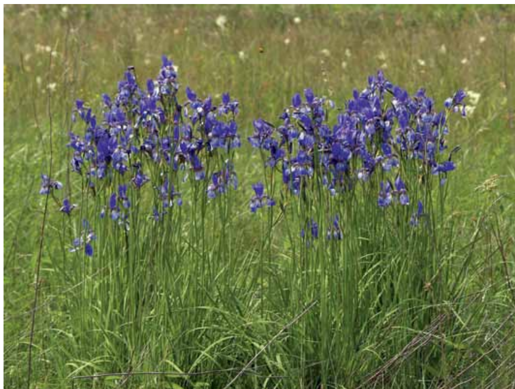
Slika 31. Travniki z močvirskim sviščem in sibirsko peruniko pri Gančanih.

Večina omenjenih travnikov pripada zvezama Molinion in Calthion , vmes pa se pojavljajo tudi družbe iz zvez Deschampsion cespitosae in Magnocaricion , bolj dognojevani travniki pa pripadajo zvezi Arrhenatherion . Med zanimivejše vrste teh močvirnih travnikov spadajo Ranunculus flammula , Trifolium fragiferum , T. dubium , Peucedanum palustre , Mentha pulegium ,