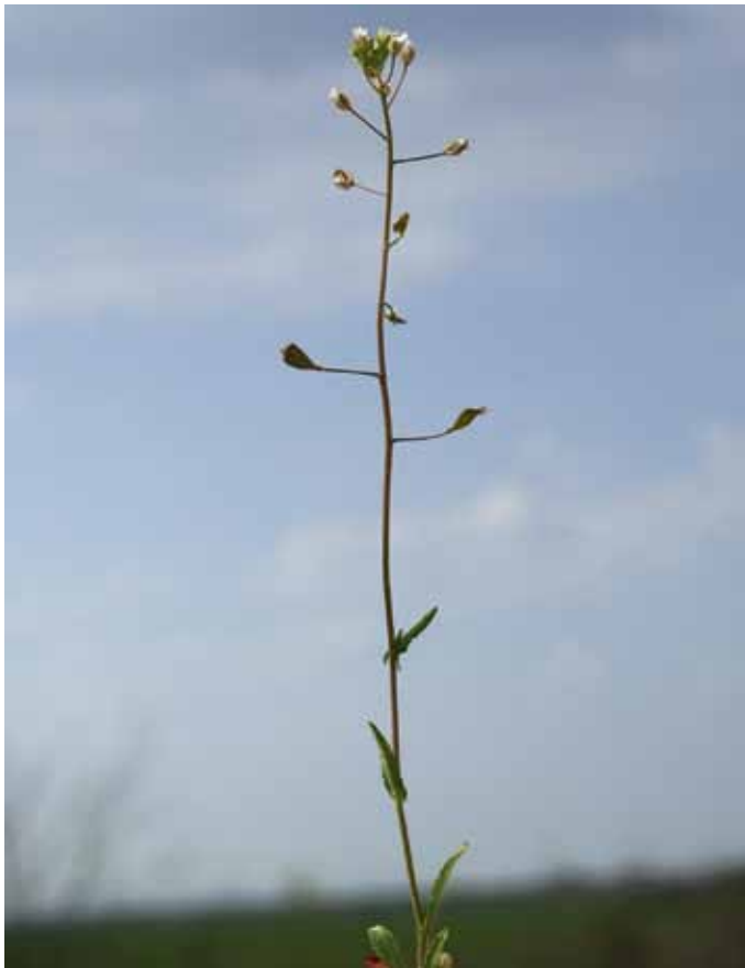
Slika 6. Capsella rubella L.

Podatki o pojavljanju rdečkastega plešca, ki izvira iz mediteranskega prostora (WRABER v MARTINČIČ et al., 2007) in se nekako širi na vzhod, izhajajo iz štajerskega in primorskega konca Slovenije (JOGAN et al., 2001). Uspeva na obdelanih tleh, peščenih mestih in ob poteh (WRABER v MARTINČIČ et al., 2007), našli pa smo ga blizu železniške postaje Lipovci. Zaradi podobnosti z navadnim pleščem ga lahko zlahka spregledamo in je morda pogostejši kot se zdi.