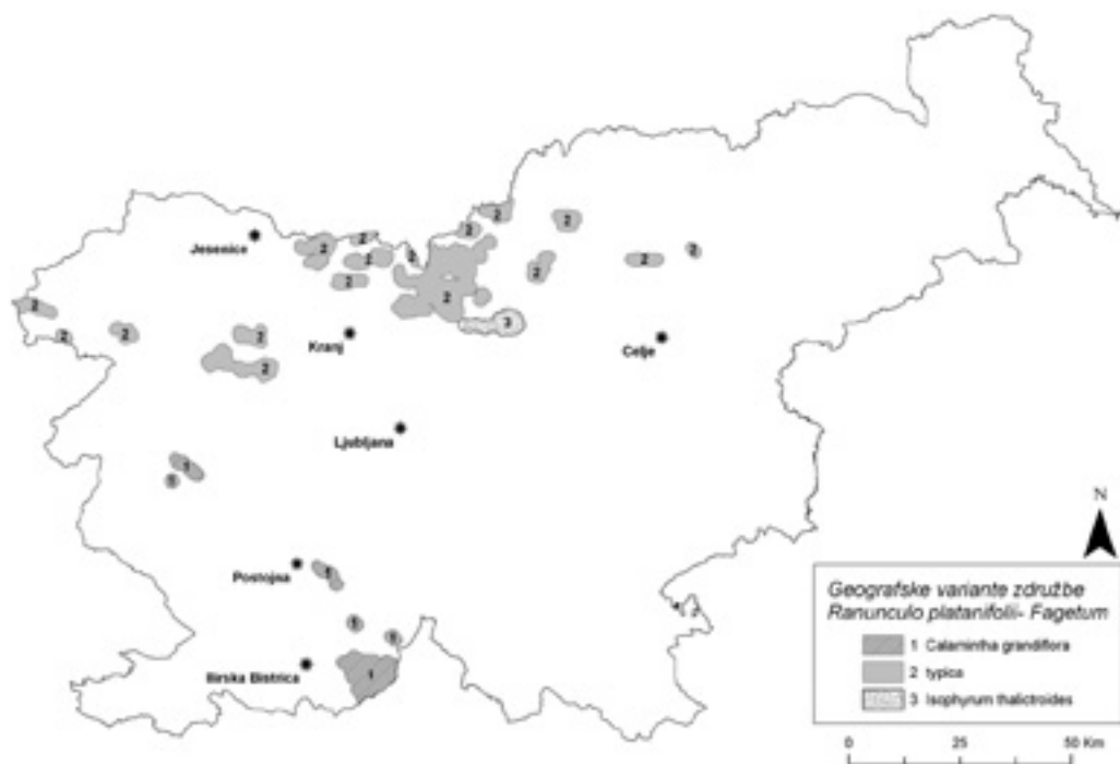
Slika 3. Geografske variante združbe Ranunculo platanifolii-Fagetum v Sloveniji (po ČARNI et al. 2002).

Osnovne ekološke značilnosti dinarske geografske variante so skoraj povsem prevladujoča apnenčasta matična podlaga, mezo- in mikroreliefno razgiban kraški relief, bolj razvita tla, rjava pokarbonatna tla in rjave rendzine, ki se med seboj mozaično prepletajo, ter zelo humidno podnebje.