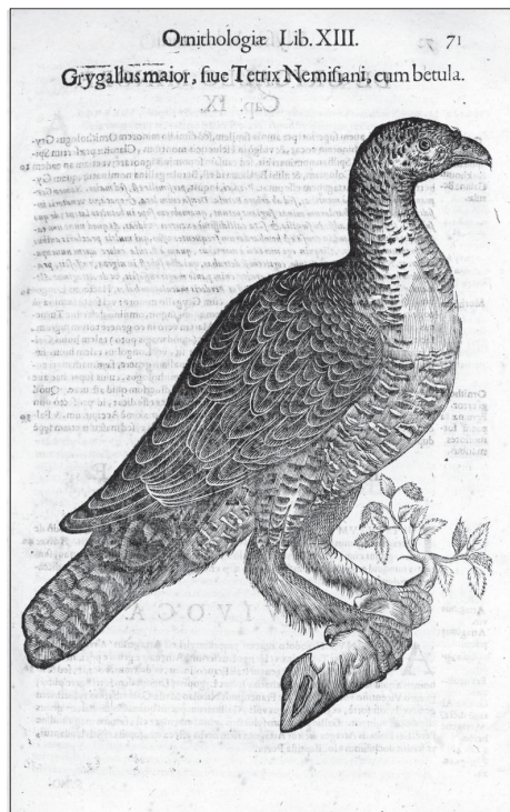
Slika 4. Samica divjega petelina (Aldrovandus, 1637). Fig. 4 Female of Capercaillie (Aldrovandus, 1637).